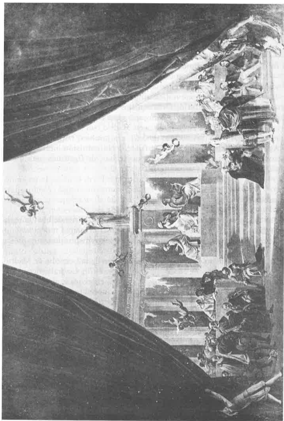
Telón de boca del Teatro de la Comedia de Madrid, estrenado el 18 de septiembre de 1875.