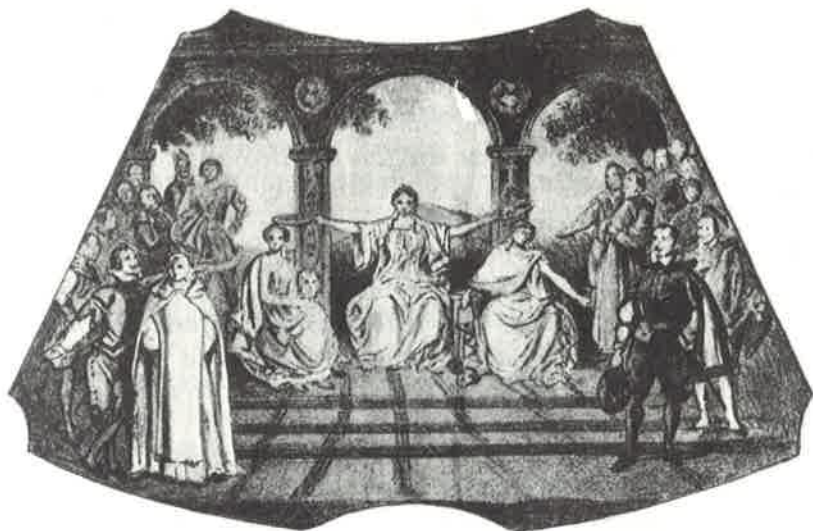
Decoración de uno de los cuatro plafones del antiguo techo del Teatro de la Zarzuela de Madrid, pintada en 1873.