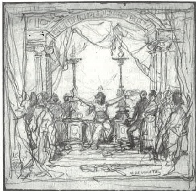
Boceto preparatorio de Unceta para el telón del Principal. Lápiz/papel, 171 × 176 mm. Hacia 1876.