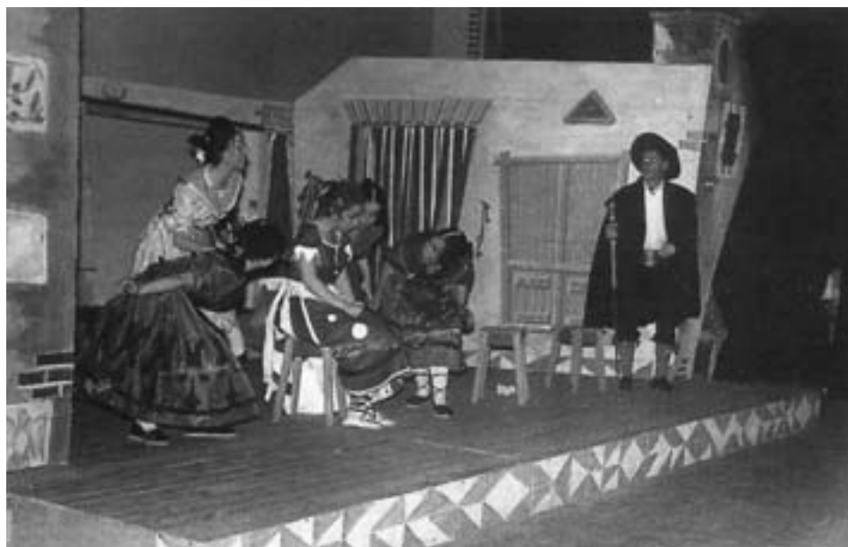
Figs. 14 y 15. Decorados de Mariano Gaspar para la representación de La zapatera prodigiosa por el TEU de Zaragoza en marzo de 1960.