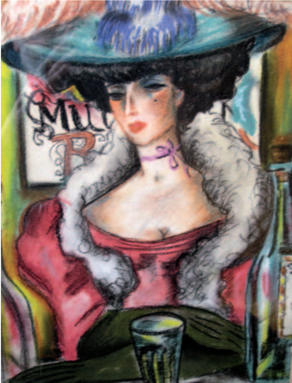
Fig. 2. Señorita. 1943, pastel, 32,2 x 21,2 cm. Zaragoza, colec. part.