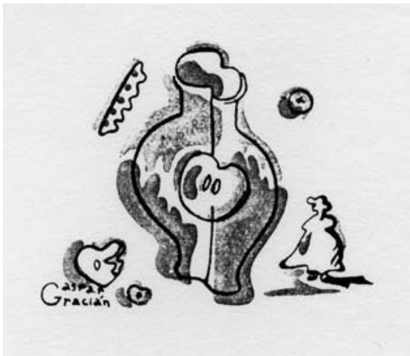
Fig. 1. Ilustración para la cubierta del librito de poemas de José M. a Vilaseca: Cancionero de la meseta, 1935.

santes experiencias psicológicas . Cabe deducir que este internamiento debió tener lugar en los años de la inmediata posguerra, pero ni se conocía hasta ahora esta circunstancia personal, ni he podido averiguar los motivos de estas experiencias o de supuestas enajenaciones transitorias.