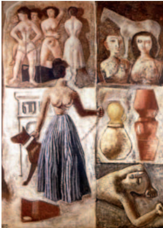
Fig. 9. M. Gaspar: Figura postista, o.l., ca. 1949-50. Cartagena, colec. part.