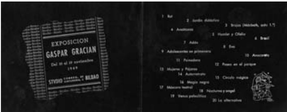
Figs. 6 y 7. Catálogo de la exposición de Gaspar Gracián en la Sala Studio de Bilbao, 1949. Timbrado sobre papel negro, portada: 12 x 15,3 cm.