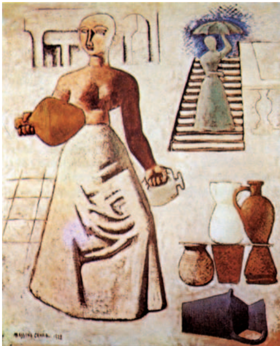
Fig. 5. Massimo Campigli: Anforas. 1928. Virginia Museum of Fine Arts.