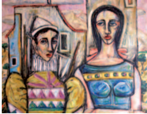
Fig. 12. Pareja de saltimbanquis, ca. 1955, o.l. Zaragoza, colec. part.

Aunque en los manuales y síntesis al uso del arte español de la posguerra apenas se ha tratado este resurgimiento de la influencia del arte italiano, antiguo y contemporáneo, su influencia en la crítica, exposiciones y artistas españoles fue bastante intensa, permanente y permeable, impulsada primero por las alianzas bélicas con el gobierno de Mussolini, preservada por d'Ors desde la Academia Breve de Crítica de Arte, y prolongada luego a través de la presencia en Roma y Florencia de jóvenes becarios como Lapayese del Río, Villaseñor, Miguel Villa o Vaquero Palacios. Estos y otros artistas sintieron y reflejaron en sus pinturas el poderoso aliento moderno de los frescos florentinos del quattrocento y, en especial, los de Piero della Francesca por la rotunda simplificación de las formas cubistas que ya habían descubierto los pintores metafísicos e interpretaron desde un nuevo ritorno all'ordine los pintores del grupo Novecento. 17