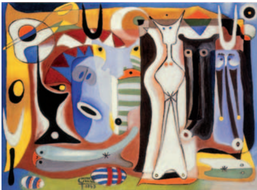
Fig. 3. Figuras. 1949, o.l., 80 x 105 cm. Galería Guillermo de Osma.