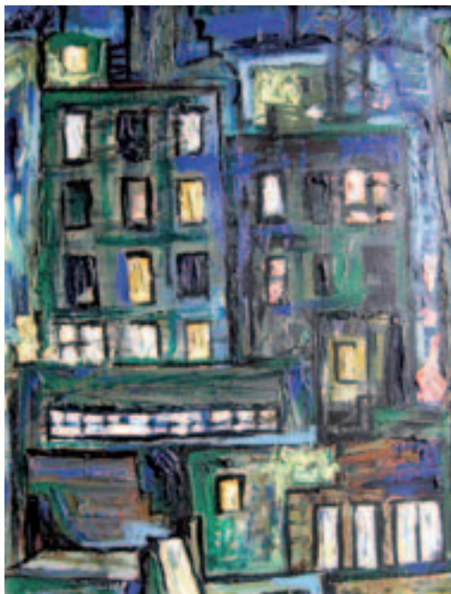
Fig. 13. Nocturno en el patio de luces, o.l. ca. 1960. Zaragoza, colec. part.

el escaso material del que disponía: tres plataformas, dos mesitas y sillas, un par de biombos, algunas cañas de bambú de las que cuelgan farolillos iluminados, dos pantallas cayendo del telar para iluminar y cerrar espacios con intensa luz cenital y una varanda que separa la escena del proscenio del espacio del director. Es decir, una escena casi vacía, con un mínimo de material, todo muy ligero, muy tenue, muy liviano, ordenado de tal modo por el artista que liberaba totalmente el espacio para el trabajo del actor. Allí había, en síntesis, sugerencias desde las figuras mobile-stabile de Calder (para todos nosotros desconocido aquellos días) hasta formas del teatro chino que tanto influyeron en Wilder. El efecto de conjunto, con un jugo de luces que el propio Mariano ideó y manipuló resultaba bello