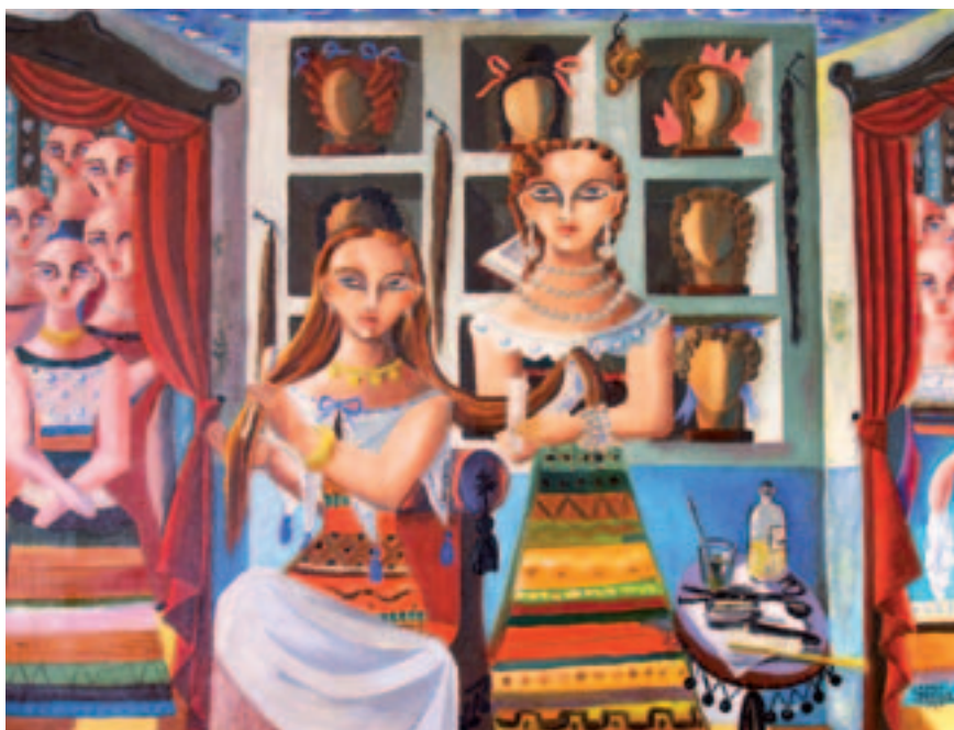
Fig. 4. Muchachas en un interior. 1949, o.l., 78 x 107 cm. Zaragoza, colec. part.